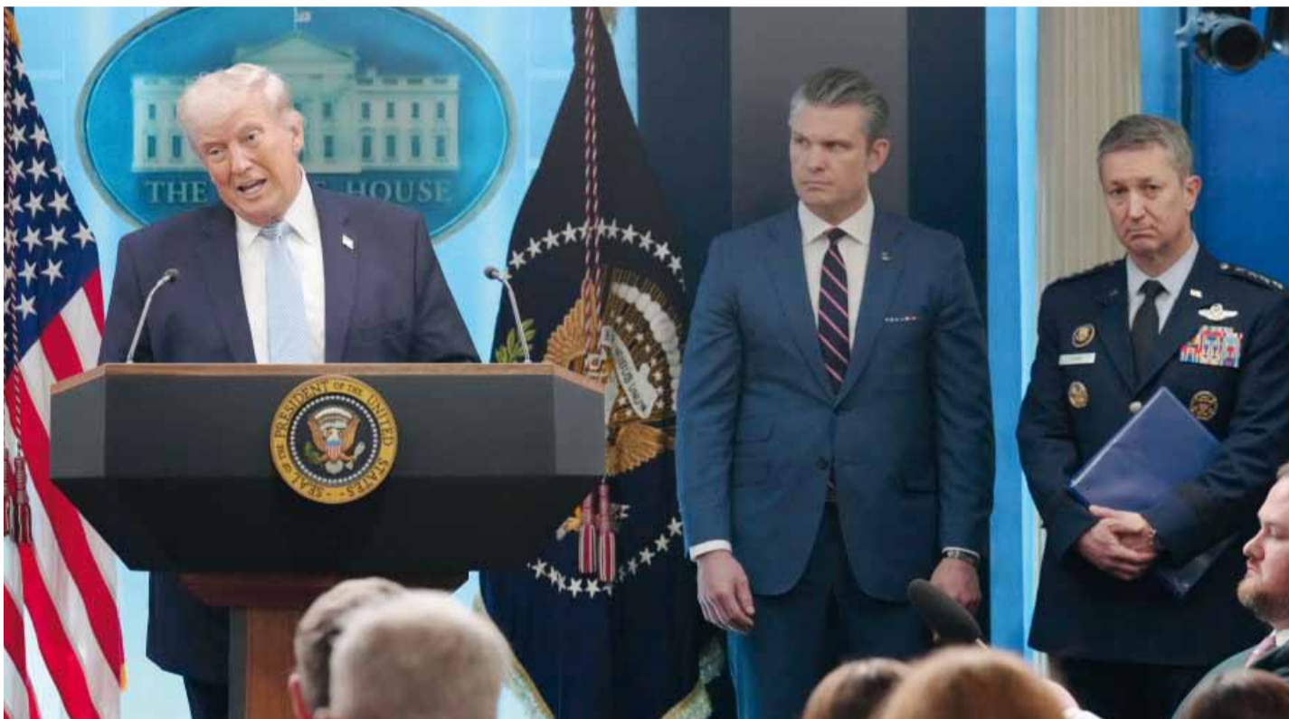
El mandatario republicano apuntó contra los medios de comunicación por la filtración de la operación de rescate de un piloto en Irán.

ción crediticia y requisitos de solvencia iguales para todos los clientes. Desde la oposición impulsan pedidos de informes en el Congreso y advierten posibles violaciones a la Ley de Ética Pública. Página 3