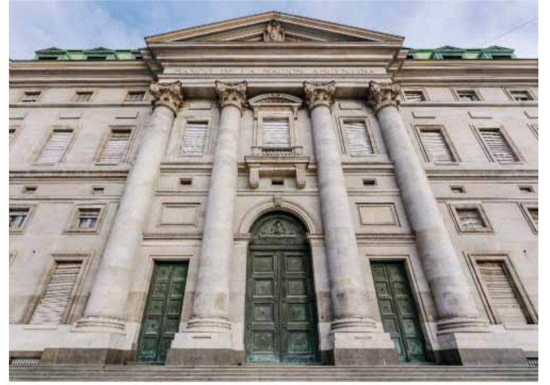
Banca pública. El Banco de la Nación Argentina.

La defensa por parte de Zagaglia se basa en las condiciones de la línea +Hogares, que ofrece "tasas preferenciales del 4,5% para usuarios que perciban haberes en el banco" y plazos extendidos, con una opción de financiamiento "hasta 30 años". Asimismo, sostuvo que el monto máximo de los préstamos es de hasta aproximadamente "$390 millones, cubriendo hasta el 75% del valor de la propiedad". También señaló que existen líneas de crédito de hasta $ 50 millones para monotri-