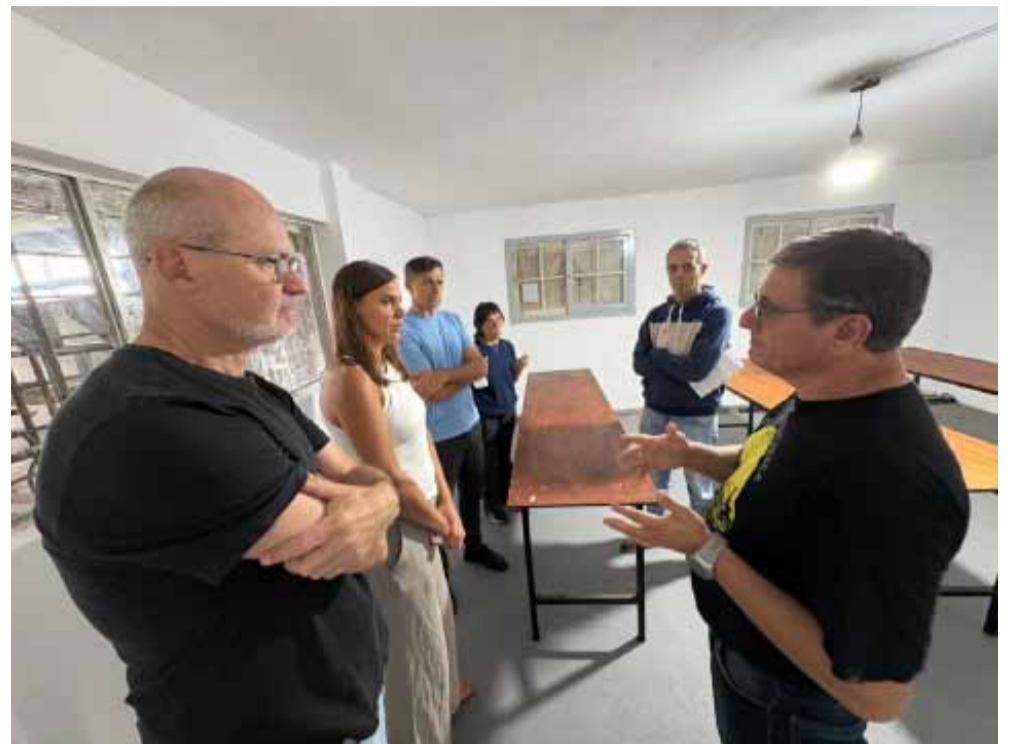
jorar las condiciones educativas y productivas de la comunidad.

De esta manera, el Municipio reafirma su compromiso con la educación pública como eje estratégico para el crecimiento de Bolívar, fortaleciendo el vínculo con las escuelas del distrito y promoviendo el trabajo conjunto para me-