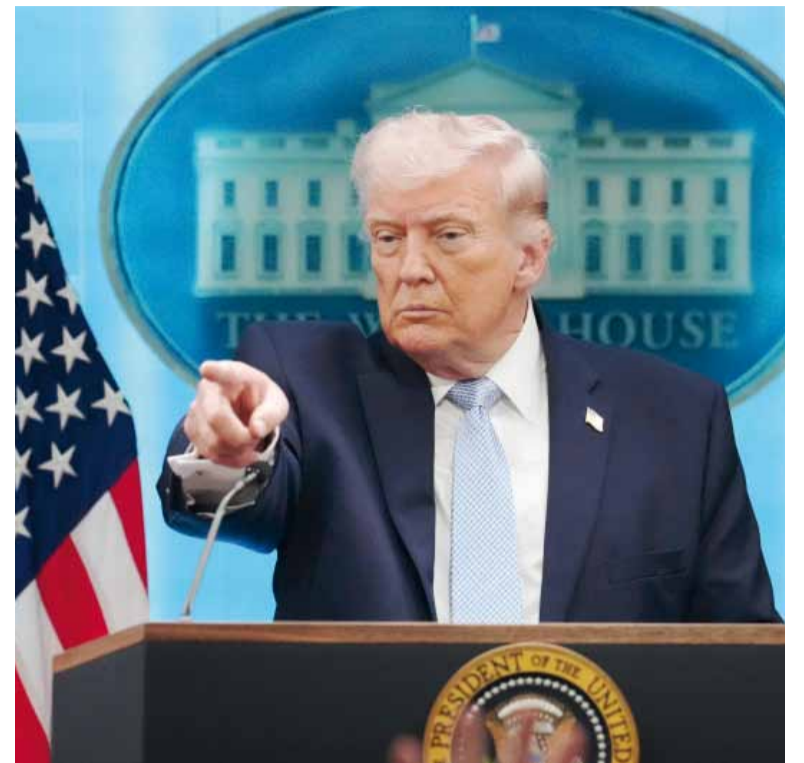
Ultimátum. El presidente estadounidense advirtió que, de no cumplirse la exigencia, avanzará con ataques contra infraestructuras críticas iraníes.

Según trascendió, el plan iraní incluye un esquema de fin de hos-