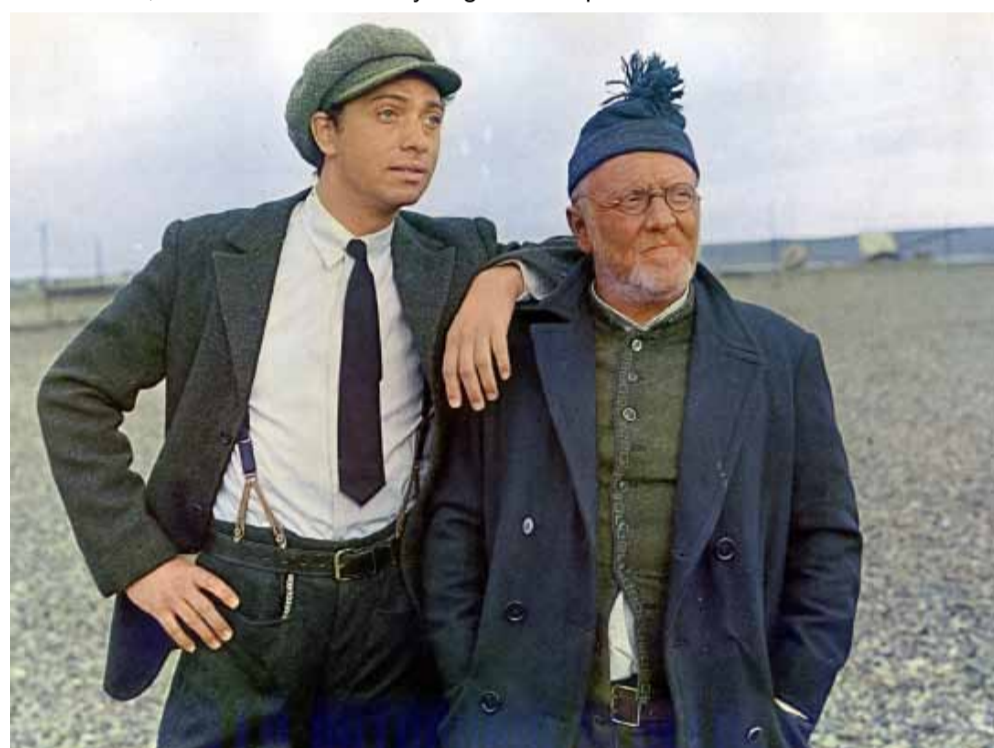
Un joven Luis Brandoni junto a Pepe Soriano.

colectivo Mujer Originaria, junto a Cultura municipal y el equipo del propio Avenida.