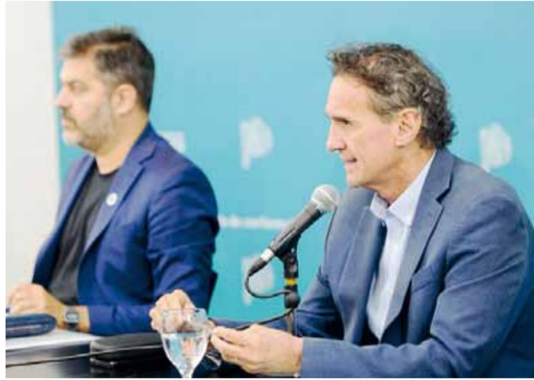
En conferencia. El ministro de Infraestructura y Servicios Públicos, Gabriel Katopodis.

"Pretendemos que hagan de veedor y que participen de todo el proceso de selección", dijo en conferencia de prensa desde la Gobernación. Y destacó que a pocos días del cierre de ofertas, se cambiaron decenas de artículos del pliego, alterando las condiciones originales. Para la Provincia, esos movimientos "desvirtúan" la competencia y abren sospechas sobre posibles